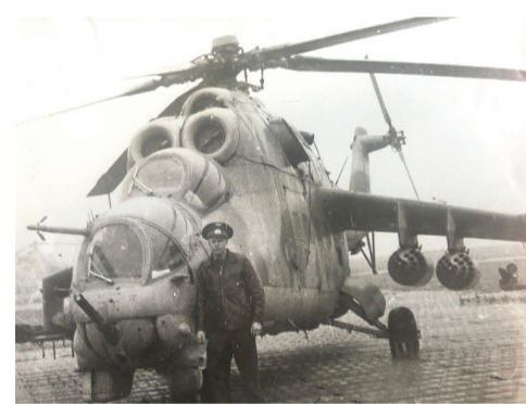
Могоча. 1988 г

Сыновья получили высшее образование и благополучно работают по выбранным специальностям.